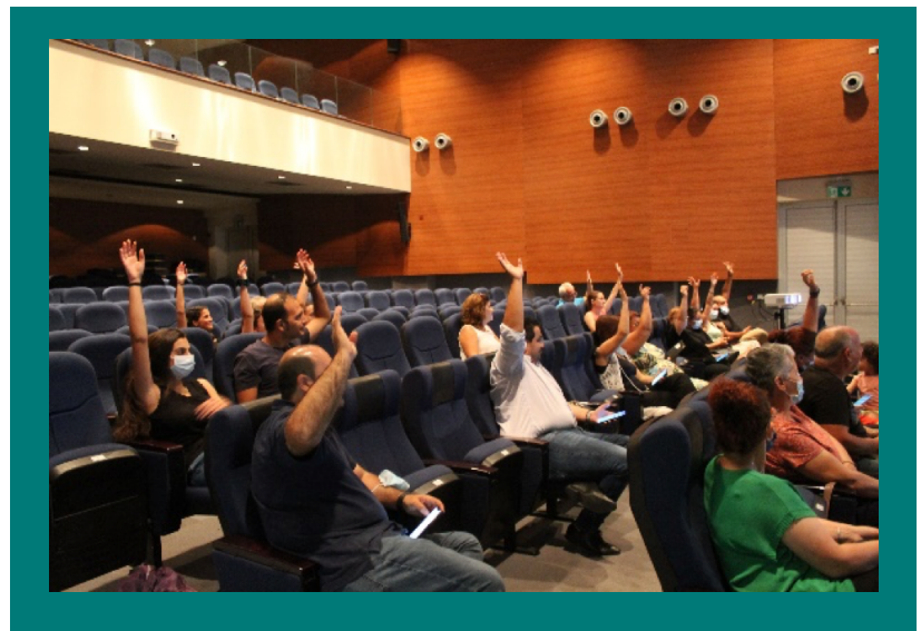
Παρουσίαση My e-Start στη Λεμεσό, 26 Ιουλίου 2022

Ελληνικά: https://forms.office.com/r/BEsZMg3Vd3